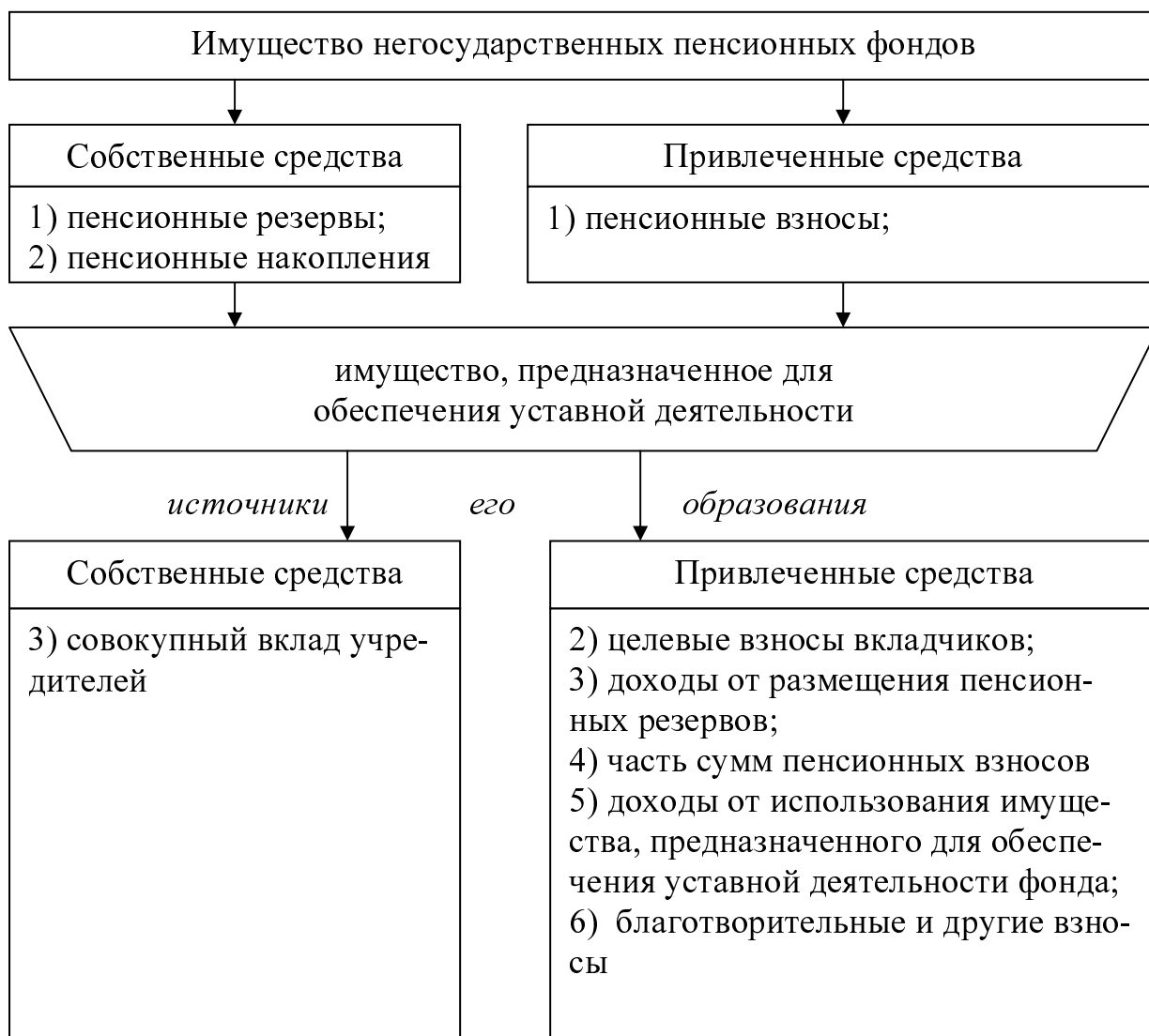
Рис. 3. Структура имущества негосударственных пенсионных фондов.

Собственное имущество фонда подразделяется на: